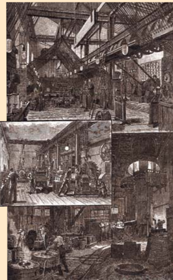
„A kéregöntő műhely, a villamos osztály próbaterme, a villamossági osztály felszerelési terme” az Osztrák-Magyar Monarchia képekben című könyvből, 1893. Dörre Tivadar metszete

Ez az időszak jelentette a Ganz és Társa Rt. nagy fejlődését is, amikor új gyárreszlegekkel és gyárakkal bővült az egykori vasöntőműhely. A Ganz-gyár a század végére nagyüzemi gépgyártásával, vasútvagon-gyártásával, az elektromos berendezések piacán elfoglalt helye alapján nemzetgazdasági jelentőségre tett szert.