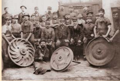
Ganz-törzsgyári munkások, 1904