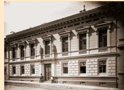
Mechwart András háza a Donáti utcában