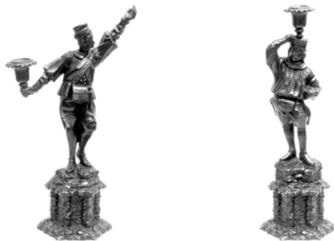
Rhónici bányászalagos gyertyatartók

Magyarországon a 19. század első felében a felvidéki Rhónic (Kisgaram, ma Hronec, Szlovákia) kincstári üzemében működött modellőrként képzett szobrász, Leopold Förster.