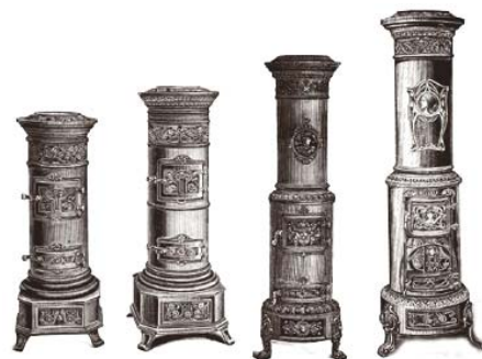
Kaláni mintaképgyűjtemény részlete, 1911

A vasöntvények térhódítása a polgári lakások cserépkályháit felváltó öntöttvas kályhák megjelenésével kezdődött. Az idők folyamán díszesebbnél díszesebb, több funkciót is ellátó, a tüzelőanyag energiáját egyre jobban hasznosító kályhatípusok kerültek ki az öntödékből. A díszítés nem öncélú volt, a bordázatok, dombsorművek növelték a hőátadó felületet.