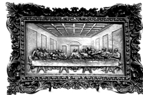
Utolsó vacsora. Aninai finomöntvény

A munkácsi vasgyár selesztói és frigyesfalvi öntödéiben folyó műöntészet Schossel 1874-ben bekövetkezett halála után lehanyaglott, de ez egybeesett ennek a művészeti ágának a lassú elsorvadásával egész Európában.