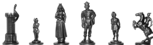
Schossel sakkfigurái történelmi alakok

A címképen kassai öntöttvas szekrénykályha látható