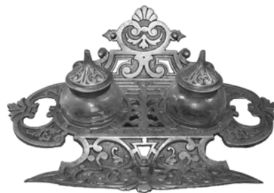
Nikkelezett öntöttvas tintatartó a 20. század elejéről

Bemutatásukkal a sokszor mostohán kezelt öntöttvas művészi alapanyagként való felhasználására, a 19–20. század fordulóján a polgári és módosabb paraszti környezetben kedvelt, mívesen formázott, finom öntésű emlékekre, az öntöttvasművészet virágkorából ránk maradt, a maga korában díszítő funkciót is ellátó tárgyak értékeire, megbecsülésére szeretnénk látogatóink figyelmét felhívni.