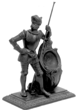
Kisplasztika Willaschek szignójával

Az alapanyag „szegényességének” leplezésére a felületet sokszor galvanikus úton álynozták (nikkelezték), esetleg bronzírozták.