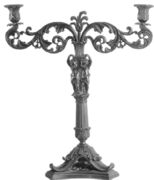
Kétkarú gyertyatartó, Munkács-Frigyesfalva

Az öntöttvasművészet virágkora című kiállítás az Öntödei Múzeum legféltettebb kincseit vonultatja fel, kiegészítve a Magyar Nemzeti Múzeum, valamint az Iparművészeti Múzeum művészi kvalitású darabjaival.